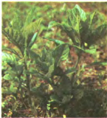
953. Скополія карніолійська